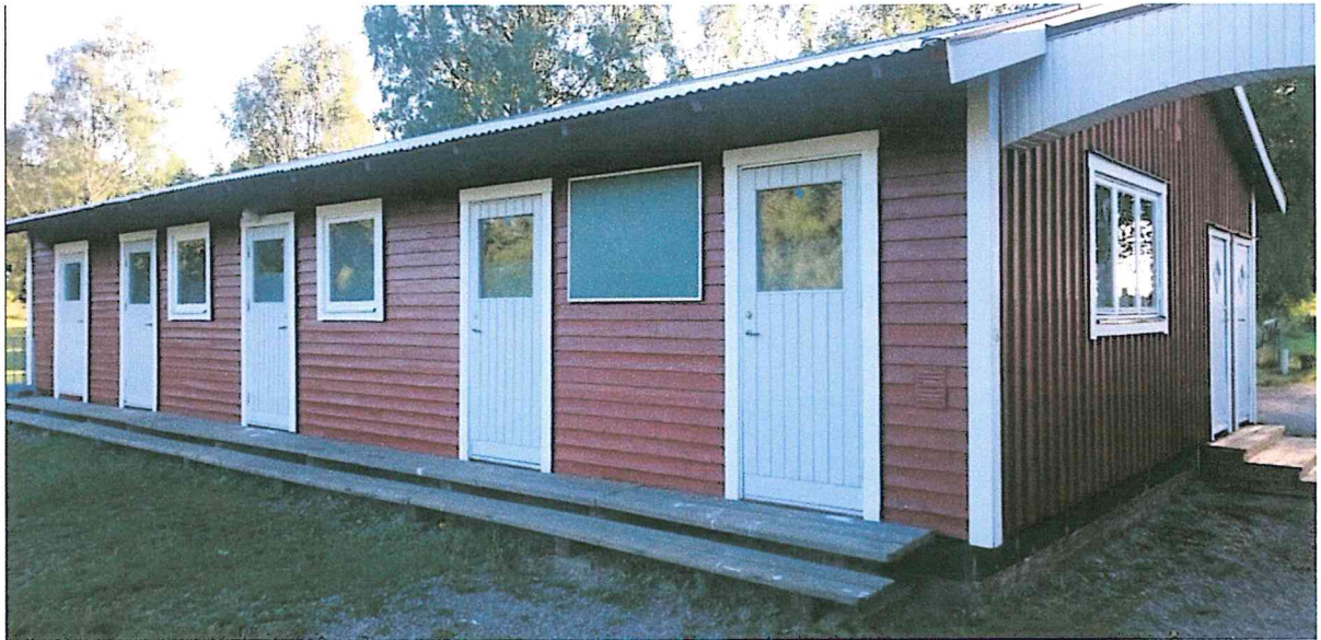
Bild: Här syns det nymålade omklädningsrummet. Även klubbhuset och kiosken målades om av sommarjobbare från kommunen (senare byggdes en ny trapp också!).

2017 beräknar vi fortsätta samarbetet genom att måla om klubbstugan inomhus.