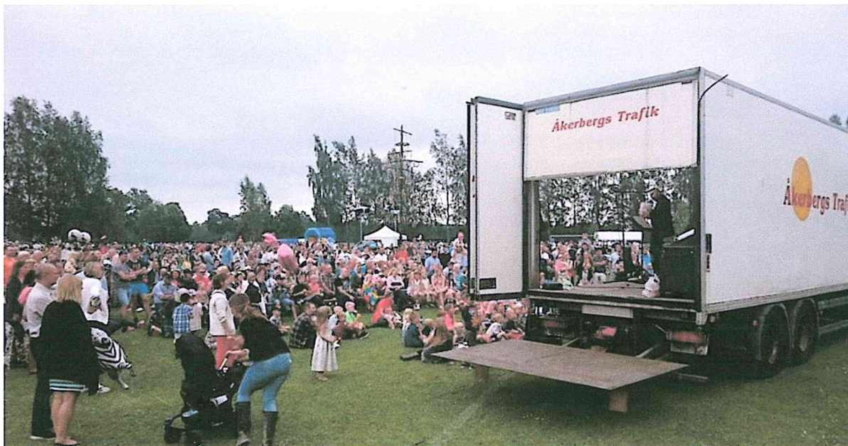
Bild: Västerljungs Ifs midsommarfirande har många populära inslag. Här är det trollkarlen som drar storpublik.

Västerljungs midsommarfirande fyllde 34 år. Midsommarfirandet är A och O i vår förening när det gäller att sätta Västerljungs IF och Norrbyvallen på kartan. Det är också på det sättet som vi ordnar in pengar för att sedan kunna erbjuda superbra aktiviteter till toklåga kostnader för de som deltar.