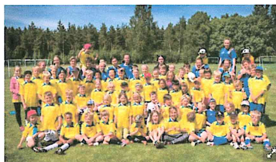
VIFs populära fotbollsskola 2016 tackar för sig