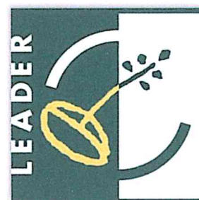
Figur: EU och Leader Sörmlandskusten stöttar Västerljungs IFs projekt "Norrbyvallens Hundarena".